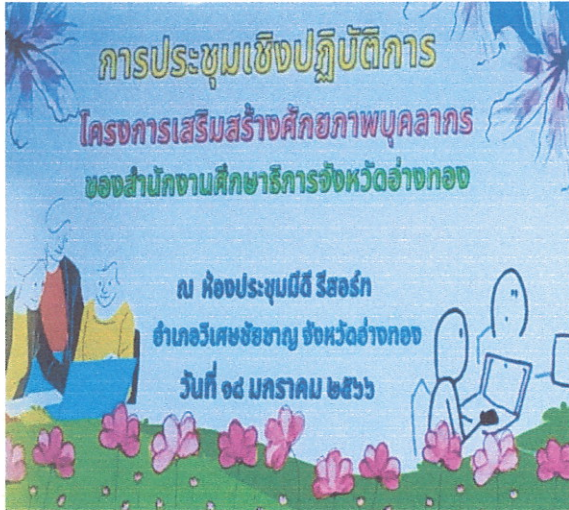
รูปภาพกิจกรรมที่ 1

10. ภาพกิจกรรมที่เกิดขึ้นภายในโครงการ / กิจกรรม (ที่สื่อถึงการดำเนินการสู่ความสำเร็จ จำนวน 5 ภาพ ขนาด file เท่ากับหรือมากกว่า 2 MB)